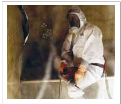
im Hochbau - bei Schadstoffsanierungen