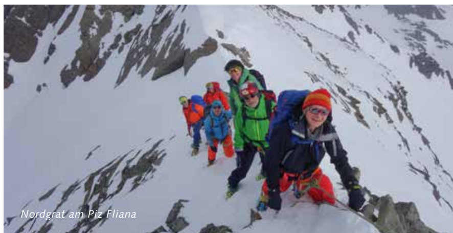
Nordgrat am Piz Fliana