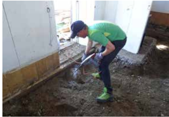
Fronarbeit Chamanna d'Es-cha und Rasché 29.–30.06.2019