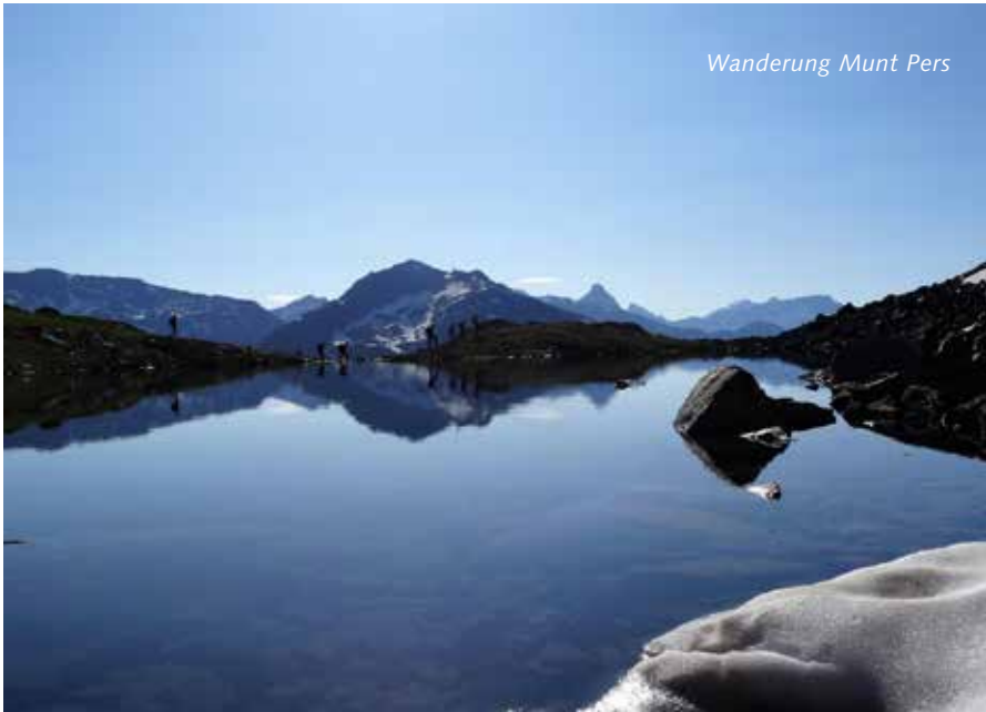
Wanderung Munt Pers