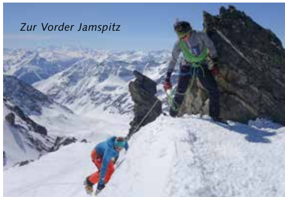
Zur Vorder Jamspitz

3. Tag: Aufstieg zum Plan Rai und über den Gletscher La Cudera zur Fuorcla dal Cunfin und weiter über Och-sengletscher zum Skidepot vom Piz Buin. Aufstieg in leichter Kletterei mit einigen Wartezeiten zum Piz Buin. Ab-fahrt am Fixseil von der Fuorcla Buin und in schönsten Gemisch aus Sulz und Pulver via Cronselt zum Kuchen in der Tuoi Hütte.