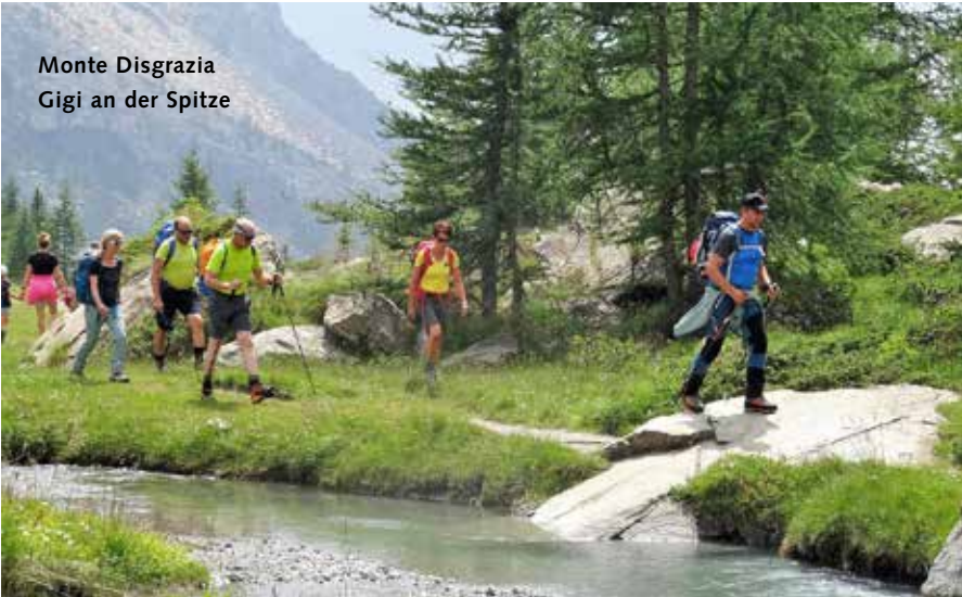
Monte Disgrazia Gigi an der Spitze

Herzliche Grüsse, Euer H. Detlef Kammeier (Mai 2019)