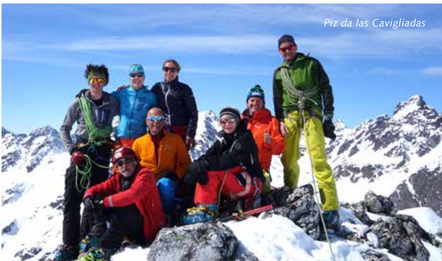
Piz da las Cavigliadas

1.Tag: Aufstieg von Guarda vorbei am Lai Blau zum Piz da las Clavigliadas. Abseilen ins schöne Couloir und Pulverabfahrt ins Val d'Urezzas. Aufstieg zur Furcletta und Abfahrt Richtung Kuchen in der Tuoi Hütte.