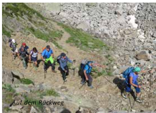
Auf dem Rückweg