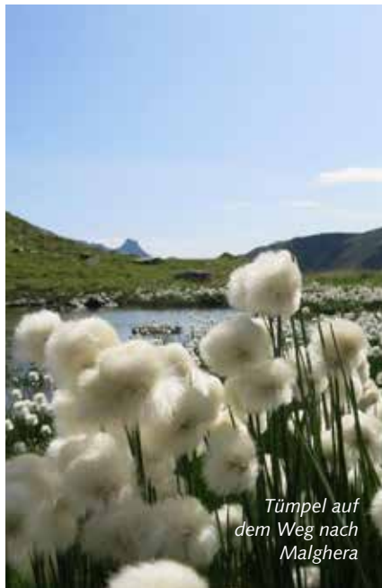
Tümpel auf dem Weg nach Malghera

Boom Sport - Galerie Bad - Via Tegatscha 5 7500 St. Moritz-Bad Tel. 081 832 22 22 - info@boom-sport.ch