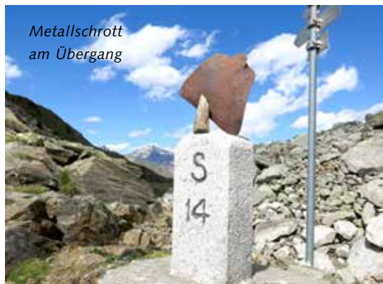
Metallschrott am Übergang