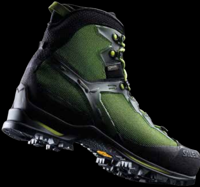
RAVEN 3 GTX

ENGINEERED IN THE HEART OF THE DOLOMITES