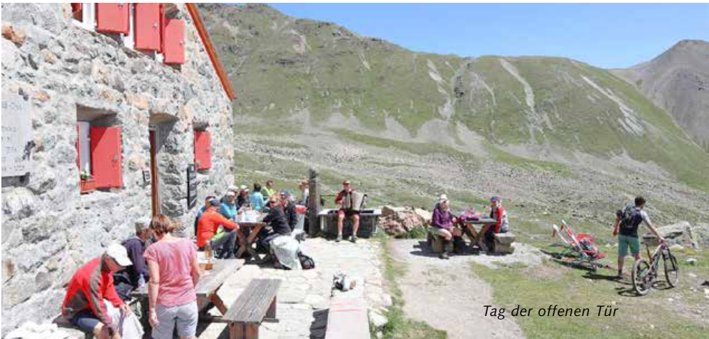
Tag der offenen Tür