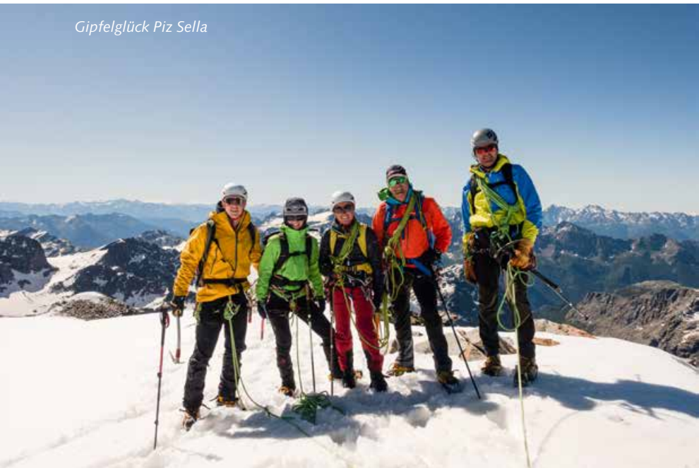
Gipfelglück Piz Sella

dessen Gipfelkette färbt sich allmählich der glasklare Nachthimmel goldgelb und macht dem Sonnenaufgang Platz – ein wahres Spektakel. Um sechs Uhr erreichen wir den Felsgrat unterhalb unseres ersten Gipfels La Sella, wo von Italien her ein kühler Wind aufzieht. Umgezogen erreichen wir über kurze Gratkletterei das erste Etappenziel La Sella. Die Eindrücke rasch aufgesaugt geht es schon weiter über eine kurze Abseilpartie und Stufe für Stufe steil den trittsicheren Firnschnee hinab zum Sattel. Den anspruchsvollsten Teil der Tour