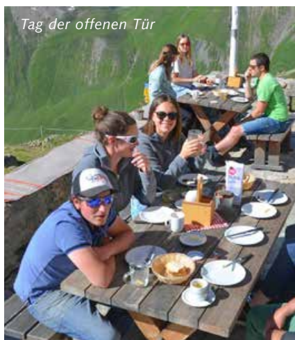
Tag der offenen Tür

Am Sonntag nahmen viele Gäste bei schönstem Sommerwetter den Weg zur Chamanna d'Es-cha unter die Füsse und Räder und nutzten den Tag der offenen Tür um die neu renovierte und umgebaute Hütte zu begutachten.