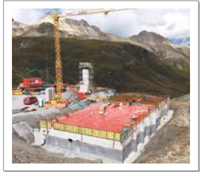
im Tiefbau - in den Bergen