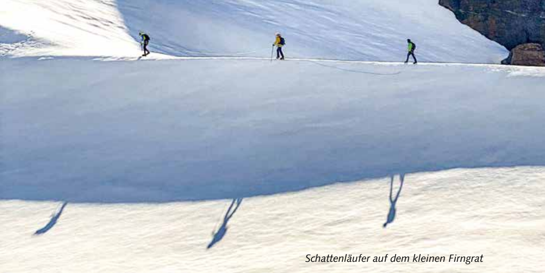
Schattenläufer auf dem kleinen Firngrat