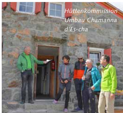
Hüttenkommission Umbau Chamanna d'Es-cha