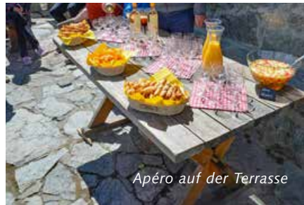
Apéro auf der Terrasse