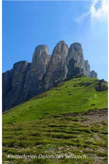
Kletterferien Dolomiten Sellajoch

Boom Sport - Galerie Bad - Via Tegjatscha 5 7500 St. Moritz-Bad Tel. 081 832 22 22 - info@boom-sport.ch