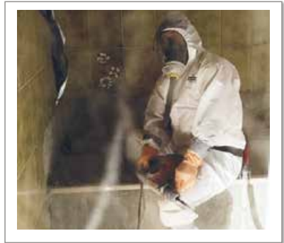
im Hochbau - bei Schadstoffsanierungen