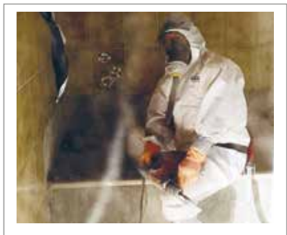
im Hochbau - bei Schadstoffsanierungen