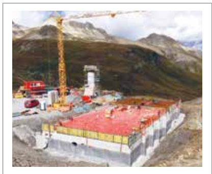
im Tiefbau - in den Bergen