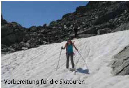
Vorbereitung für die Skitouren