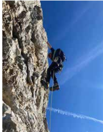
Las Trais Fluors (Miro)

Mit den ersten Sonnenstrahlen blickte ich runter auf 6 Alpinisten. Sie kamen näher und näher. Nach einer Stunde standen sie bereits am Fusse meines Nachbars. Nach dem Vorspiel am Piz dal Büz, welcher seine Krallen gezeigt hatte, gab ich mich den 2 Seilschaften spielend hin, sodass alle nach einigem rauf und runter den Höhepunkt erreichen konnten.