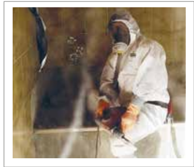
im Hochbau - bei Schadstoffsanierungen