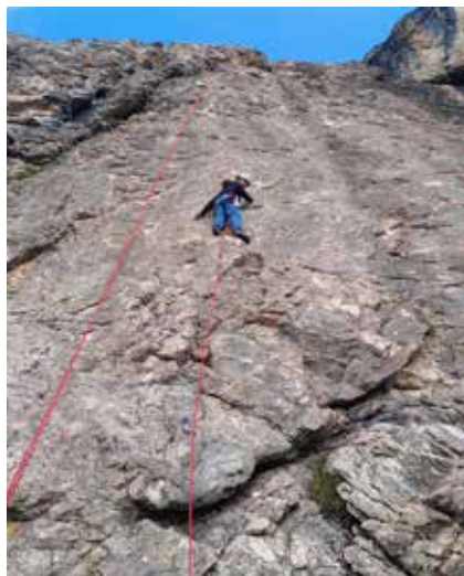
Klettern und Bouldern sind die beliebtesten Aktivitäten in der JO