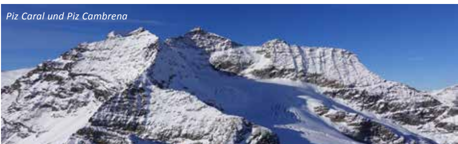
Piz Caral und Piz Cambrena