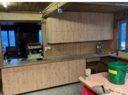
Die neue Küche

Zu Beginn der Saison konnten einige Unterhaltsarbeiten, sowie Neuinstallationen getätigt werden. So wurde eine neue Abwaschmaschine inkl. notwendigem Boiler installiert und einen Teil der Küchenschränke konnte erneuert werden. Dies erleichtert den Betrieb enorm sowie sind die hygienischen Bedingungen deutlich verbessert. Im Herbst konnte der neue Wasserschacht der Turbine ersetzt werden. Dadurch kann ein Wasserverlust wie bei der alten und undichten Wasserfassung vermindert werden. Dies ist in wasserarmen Zeiten dringendst notwendig. Die Brücke auf dem Hüttenweg hat Schaden genommen und war nur noch schlecht passierbar, sie wurde ersetzt. Der schneearme Winter und die hohen Temperaturen haben massive Spuren und Veränderungen am Berg und auf dem Gletscher hinterlassen. Deshalb musste die Route am Morteratsch mehrfach geändert und angepasst werden um die Tour sicherer zu gestalten.