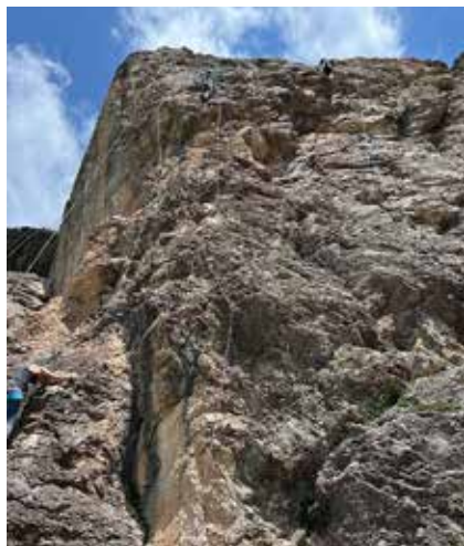
Klettern und Bouldern sind die beliebtesten Aktivitäten in der JO