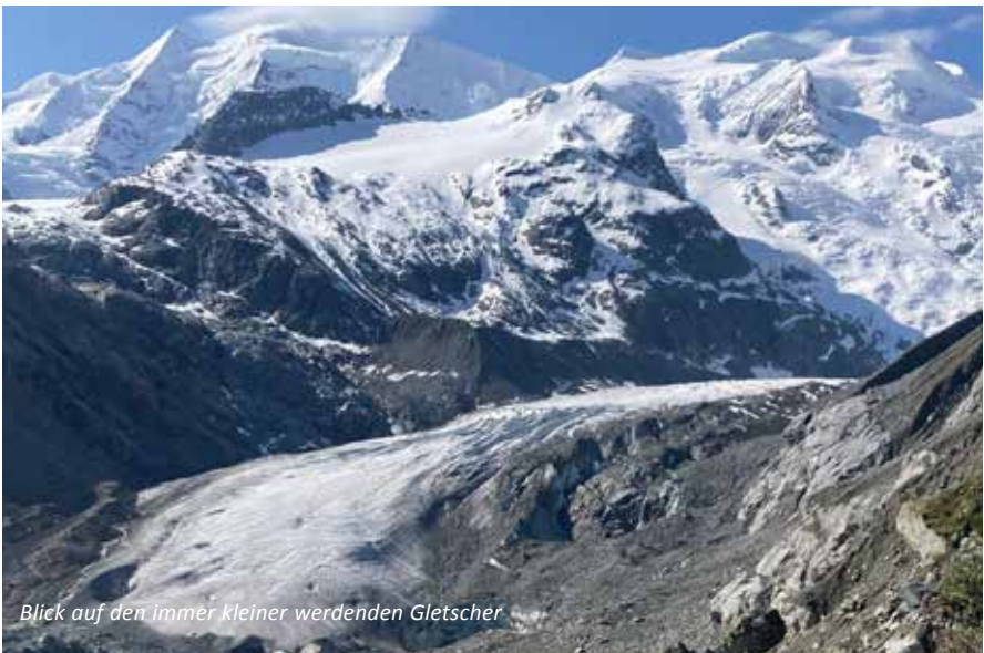
Blick auf den immer kleiner werdenden Gletscher