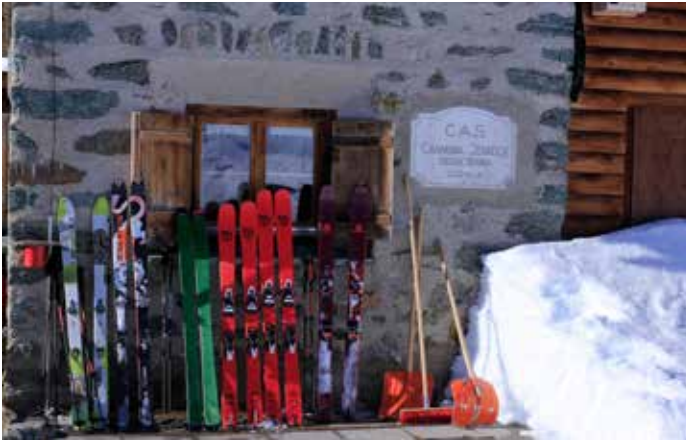
Skidepot vor der Hütte