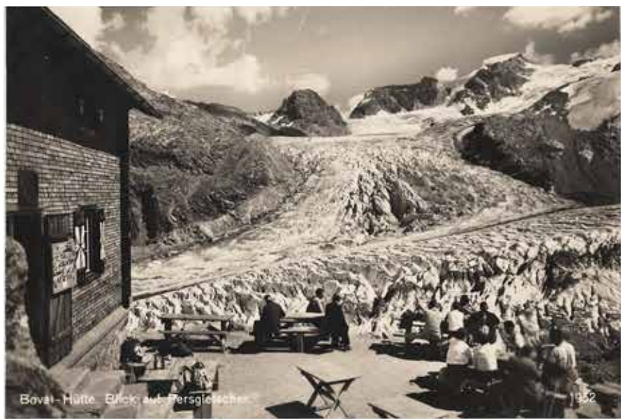
Bovai-Hütte. Blick auf Berggletscher.