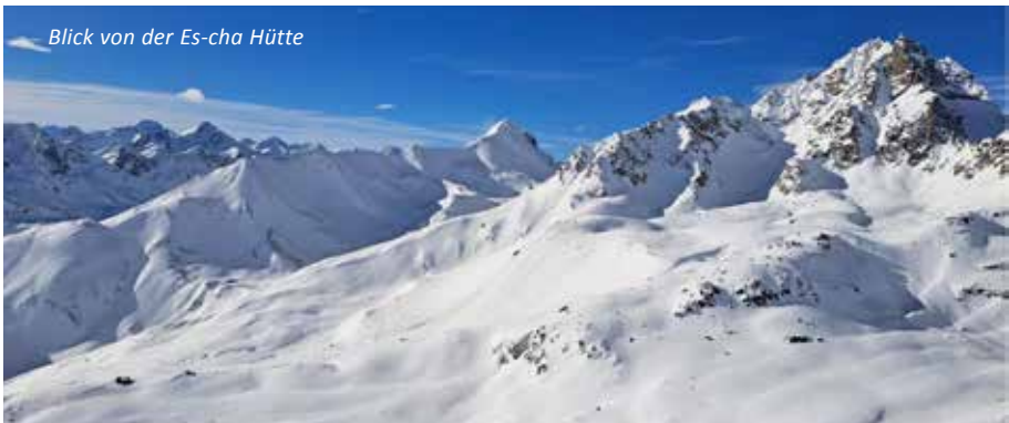
Blick von der Es-cha Hütte