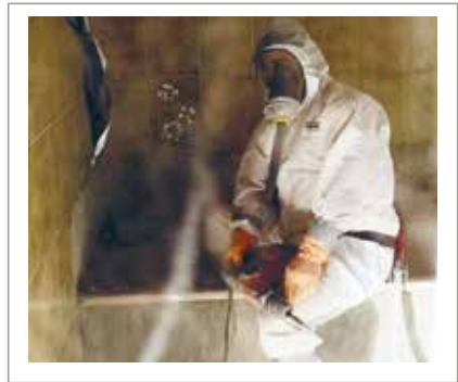
im Hochbau - bei Schadstoffsanierungen