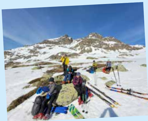
Das Wetter zeigte sich von seiner besten Seite. Hier machten wir eine kurze Pause.