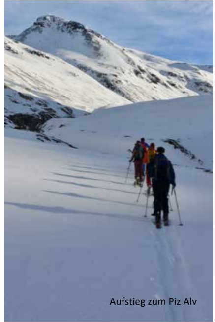
Aufstieg zum Piz Alv

Boom Sport - Galerie Bad - Via Tegliatscha 5 7500 St. Moritz-Bad Tel. 081 832 22 22 - info@boom-sport.ch