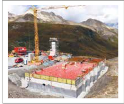
im Tiefbau - in den Bergen