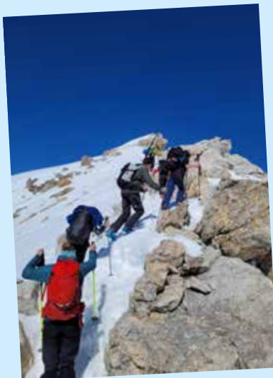
Auf dem Grat Richtung Ziel.